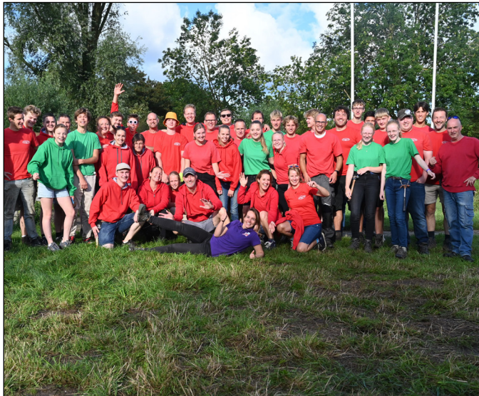
Onze vrijwilligers zorgen elk jaar weer voor een Timmerdorp-feest

CASTRICUM - De Olympische Spelen in Parijs zijn misschien al afgelopen, maar in Castricum gaan we nog even door. Ook op het Timmerdorp gaan we voor de medailles. Nee, niet voor de hoogte of mooiste hut, maar wel voor de gezelligheid! Halen we met TiDoCa goud dit jaar?